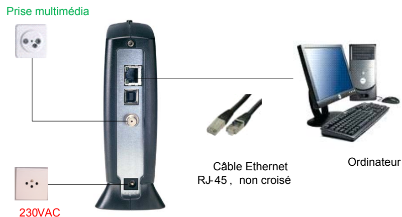
Schéma de connexion :

Descriptif des LED (lampes vertes ou oranges) situées sur le modem