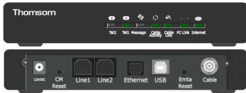
Modèles THG520 ou THG540

Pour que la connexion Internet ainsi que le téléphone fonctionnent, toutes les LED vertes doivent être allumées (la LED "Activity" peut clignoter en cas de transfert d'informations entre l'ordinateur et le routeur).