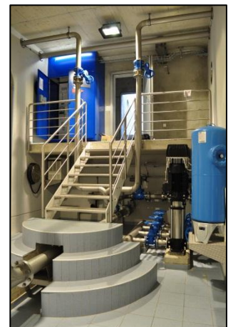
Photos : réservoir de Surpin